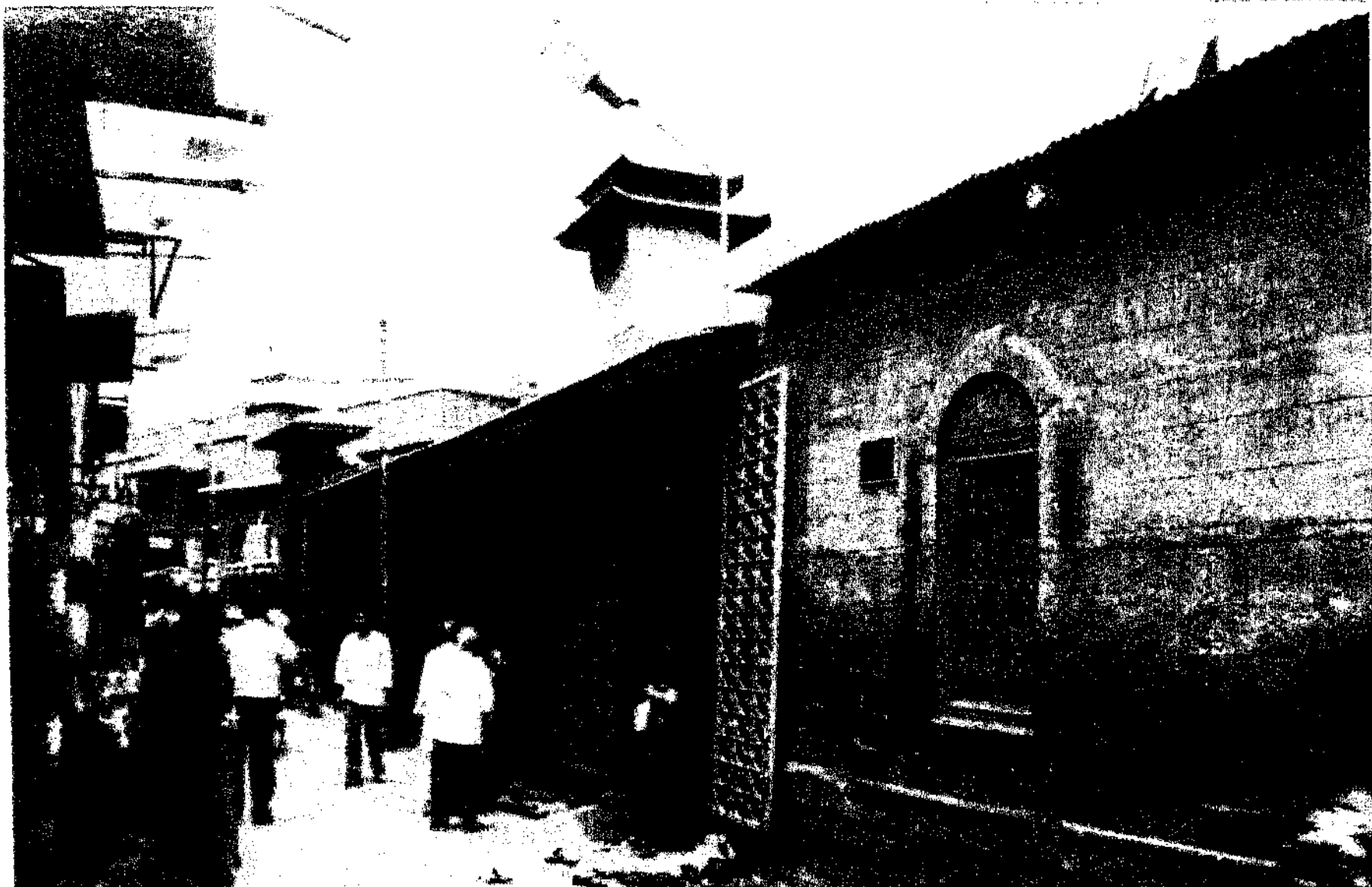
Shri Sai Baba's Dwarkamai