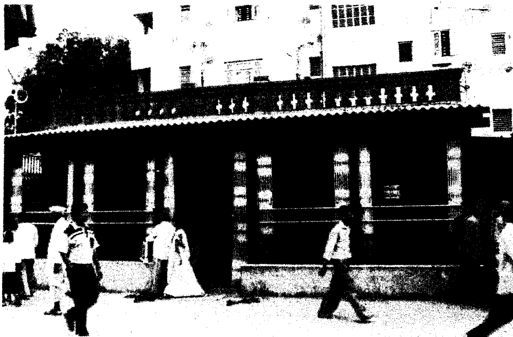
Shri Sai Baba's Chawadi