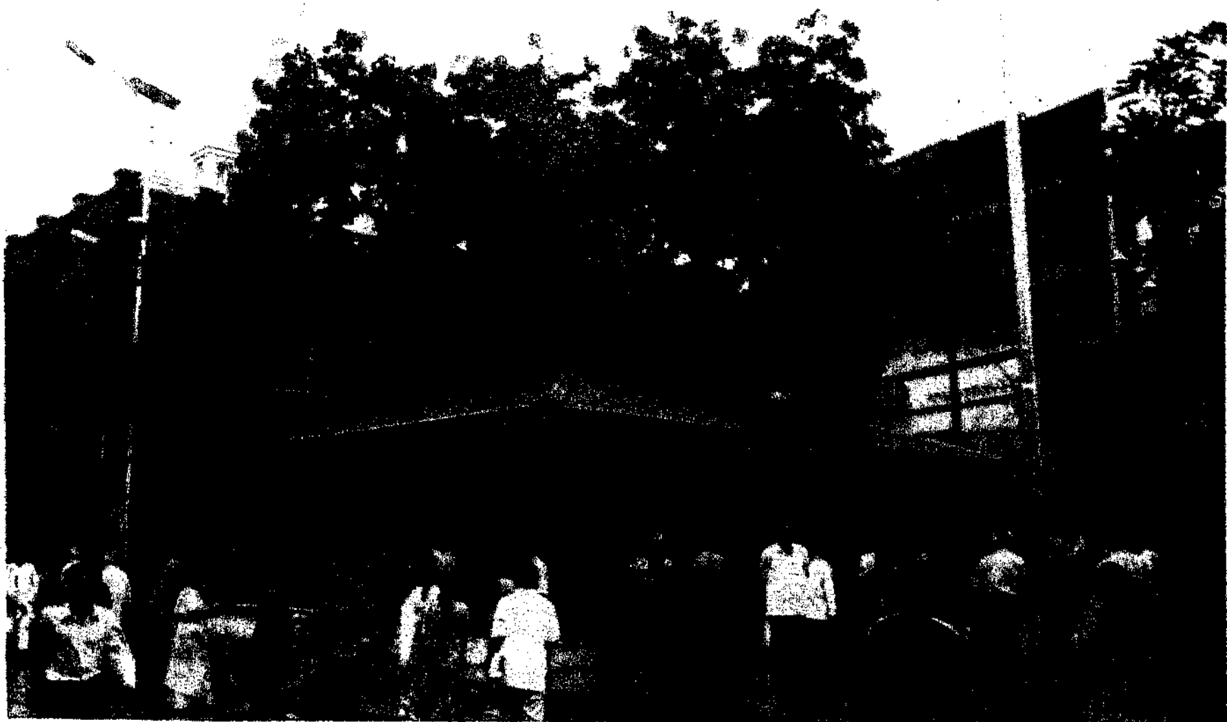
Shri Sai Baba's Gurusthan